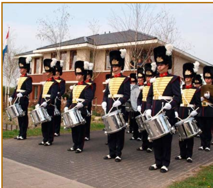
Tijdens het bloemencorso van 16 april werden wij getrakteerd op een aubade van onze Sasenheimse trots: Adest Musica